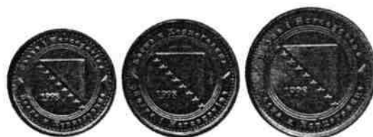
2. ábra. A fém pénzek hátlapja