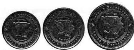
1. ábra. A fém pénzek előlapja

jegyek körül a „fening” felirat olvasható. Az értékjelzés a 10 és 50 feningesnél a számjegy fölött latin betűkkel, alatta pedig cirill betűkkel van kiírva, a 20 feningesnél fordítva. Az ország nevének latin- és cirill írású változatát a köriratban háromszög választja el, amelyet kívülről gyöngykör, belül hármastriangulus keretez. (1. kép)