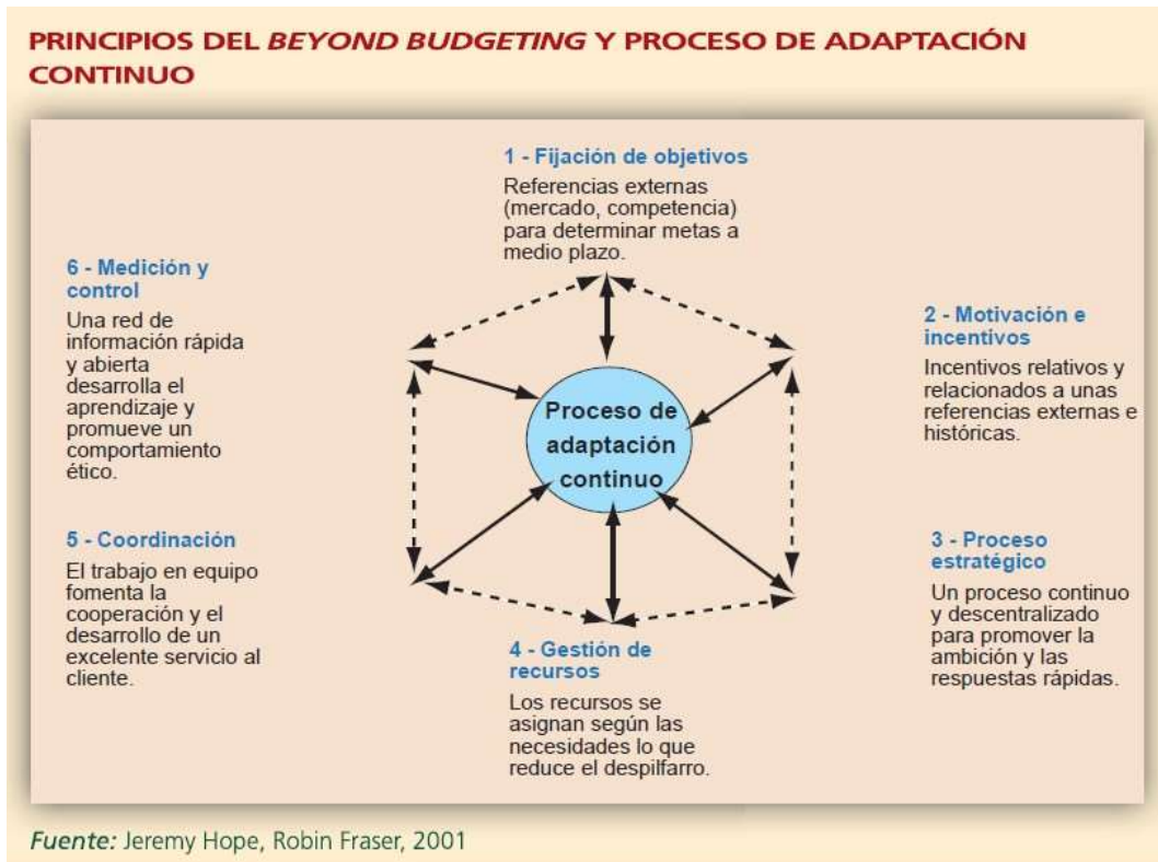
Figura 2 Principio del Beyond Budgeting y proceso de adaptación continuo

A continuación en la figura 2 se detalla los principios clave del modelo Beyond Budgeting, que permite a la empresa desarrollar su actividad gracias a un proceso de adaptación continua (Lorain, y Urquía, (2008, p.93).