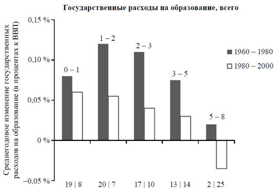
Рис. 2. Государственные расходы на образование в период до и после глобализации

Обнаружилась необходимость поиска альтернативных путей. Но в ситуации преобладания нелиберального образа мыслей немногочисленные попытки предложить альтернативные подходы трудно находят путь к публичному рассмотрению – как правило, они хоть и не замалчиваются, но за малым исключением не имеют почти никакого практического влияния.