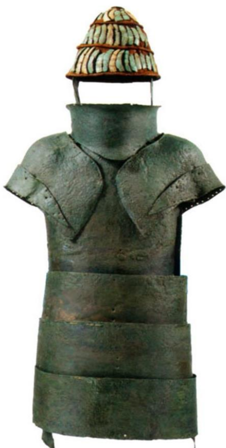
Η πανοπλία στο Δενδρί, μοναδική του είδους της στην Ευρώπη, πιθανώς και στον κόσμο, εκτίθεται σήμερα στο Αρχαιολογικό Μουσείο του Ναυπλίου

Στα μυκηναϊκά βασίλεια, το έκανε πρώτα ο άναξ με τους ευγενείς - αριστοκράτες του βασιλείου, και σε πολύ μικρότερο βαθμό και με μικρότερη αποτελεσματικότητα οι απλοί κάτοικοι (ακόμα δεν μπορούμε να τους ονομάσουμε “πολίτες”). Αυτό που ξεχώριζε τον άνακτα και τους ευγενείς από τον κοινό λαό, ήταν το πως πολεμούσαν. Έχει διασωθεί μία πλήρης μυκηναϊκή πανοπλία, από τάφο στο Δενδρί της Αργολίδας καθώς και κάποιες αναπαραστάσεις σε αγγεία. Η πανοπλία του Δενδρί είναι φτιαγμένη από μπρούντζο, σε διαδοχικές κυλινδρικές πλάκες, που καλύπτουν ολόκληρο το σώμα, τα πόδια, τα χέρια, και συμπληρώνονται από κράνος, μερικές φορές από δόντια αγριόχοιρου. Η πανοπλία στο Δενδρί θυμίζει πολύ τις πανοπλίες των φοβερών κατάφρακτων ιππέων του Βυζαντίου τον 11 ο αιώνα και των μεσαιωνικών ιπποτών της Δύσης (από τον 13 ο αιώνα).