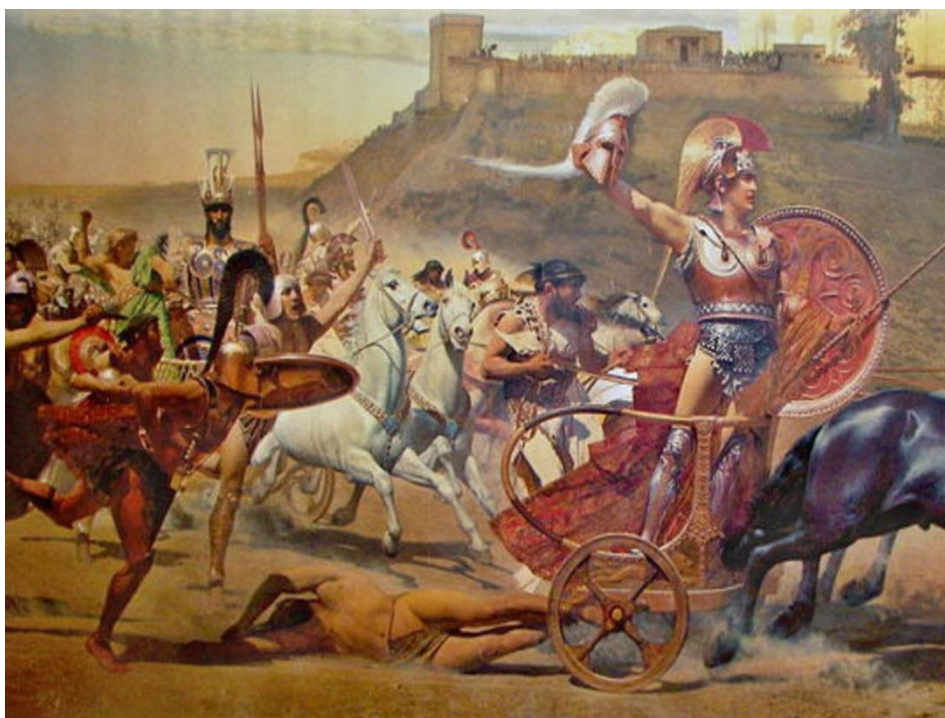
Ο πολέμαρχος των Ελλήνων, Αχιλλέας πάνω σε πολεμικό άρμα κάνει τον γύρο του θριάμβου μετά την μονομαχία που οδήγησε στο θάνατο του Έκτορα.

Τη μυκηναϊκή περίοδο στην περιοχή όπου άνθισε ο μυκηναϊκός πολιτισμός (από την Θεσσαλία μέχρι την Κρήτη) υπήρχαν το πολύ 100 βασιλεία 3 . Ο Η.Μ. Hansen, έχει καταγράψει, κυρίως για την κλασική εποχή, στον ελληνικό χώρο πάνω από 1.000 πόλεις κράτη (από την Ισπανία μέχρι τον Εύξεινο Πόντο) από τις οποίες πάνω από 500 στο χώρο που πριν από την καταστροφή κάλυπτε ο μυκηναϊκός μακροπολιτισμός. Αυτό απλά σήμαινε πως κατά μέσο όρο τη θέση κάθε μυκηναϊκού βασιλείου είχαν διαδεχθεί, αναλογικά, πέντε πολύ μικρότερες, ως μικροσκοπικές πόλεις-κράτη ως προς την εδαφική έκταση και τον πληθυσμό και επακόλουθα ως προς τα οικονομικά μεγέθη (το σημερινό ΑΕΠ). Το πόσο μικρά ήταν ορισμένα από τα κράτη αυτά γίνεται φανερό π.χ. αν αναλογισθούμε πως οι αρχαίες Πλαταιές απέχουν σε ευθεία μόλις 12 χιλιόμετρα από τις Υσίες και εκείνες μόλις 6 από τις Ερυθρές.