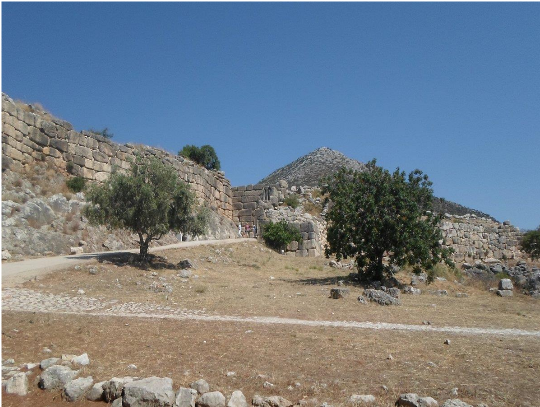
Αποψη του τείχους των Μυκηνών. Στο βάθος η πύλη των Λεόντων.

κράτους και το παλάτι του, όπως εκείνα που σώζονται στις Μυκήνες, Πύλο, Τίρυνθα, Μιδέα, Γλα, Ιωλκό, Σπάρτη, Ιθάκη κ.λπ. Υπήρχε ένα καθεστώς ιδιοκτησίας γης και κοπαδιών που αφορούσε ιερά ή ιδιώτες, όμως το μεγάλο τμήμα γης, κοπαδιών και βιοτεχνικής παραγωγής ανήκε στο παλάτι. Έτσι, έχουν αποκαλέσει αυτή τη μορφή παραγωγής “οικονομία των παλατιών” 2 .