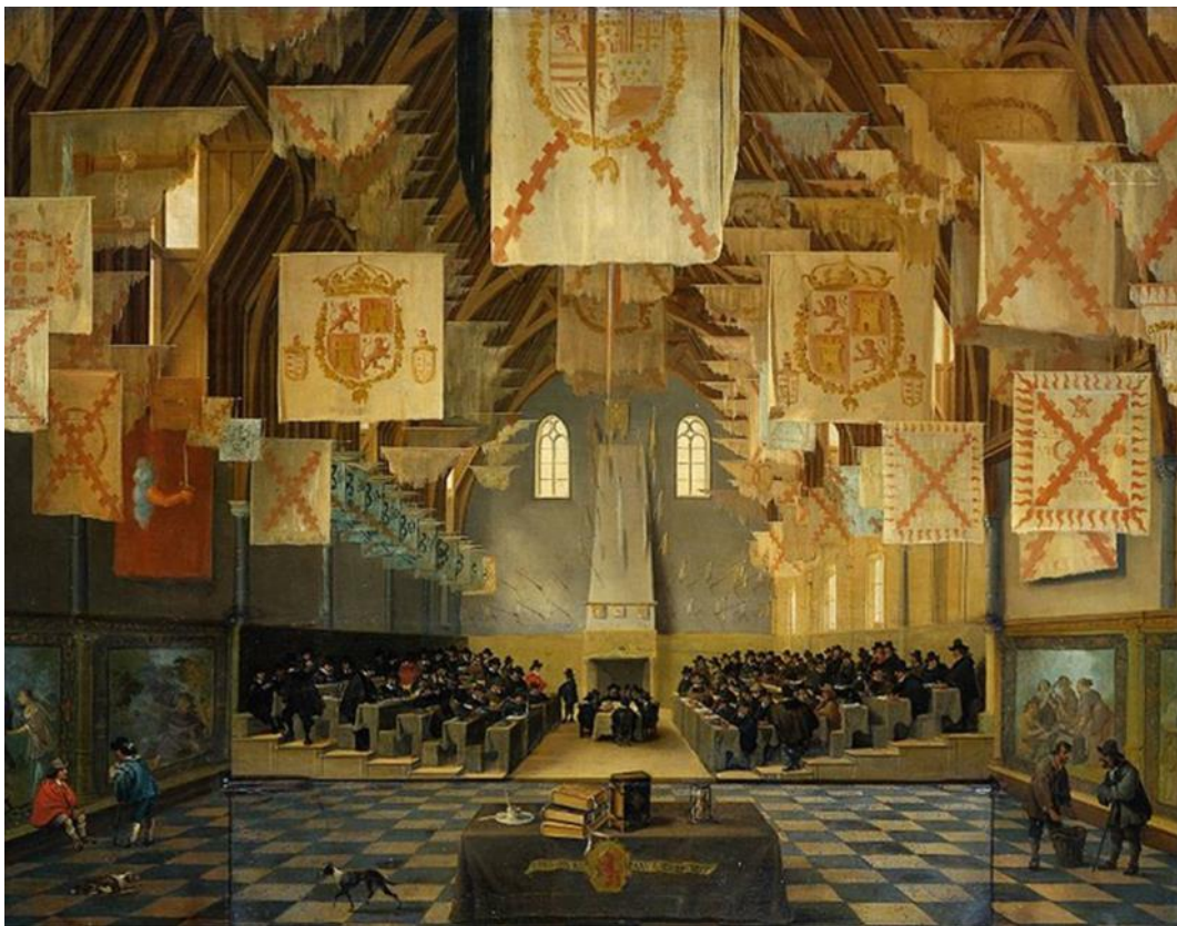
Εικόνα 1 : Συνεδρίαση της Μεγάλης Συνέλευσης των Γενικών Τάξεων το 1651

επαρχίες που απάρτιζαν την ομοσπονδία. Οι πόλεις, με κυριότερη το Άμστερνταμ, διοικούνταν από την τάξη των ρεχέντεν (regenten) κυρίως εμπόρους, επιχειρηματίες και λίγους ευγενείς που εξέλεγαν τους δημάρχους και το δημοτικό συμβούλιο. Δεν υπήρχε δημοκρατία στο επίπεδο της πόλης, αλλά ολιγαρχικές διοικήσεις γιατί οι υπόλοιποι κάτοικοι δεν είχαν δικαίωμα ψήφου. Υπήρχε ωστόσο ένα είδος ισονομίας και ισχυρή προστασία των δικαιωμάτων ιδιοκτησίας. Στο επίπεδο των επτά ξεχωριστών επαρχιών, υπήρχαν οι Γενικές Τάξεις ( Staten-Generaal ), δηλαδή μια εκδοχή κοινοβουλίου που τα μέλη του εκλέγονταν δημοκρατικά από τις Επαρχίες στις πόλεις τους, δηλαδή τους ρεχέντεν . Συνεπώς, στο επίπεδο της ομοσπονδίας υπήρχε αντίστοιχο Κοινοβούλιο ( Γενικές Τάξεις ) που τα μέλη του εκλέγονταν δημοκρατικά, με έδρα την πρωτεύουσα της ομοσπονδίας Χάγη, έδρα και της ομοσπονδιακής διοίκησης.