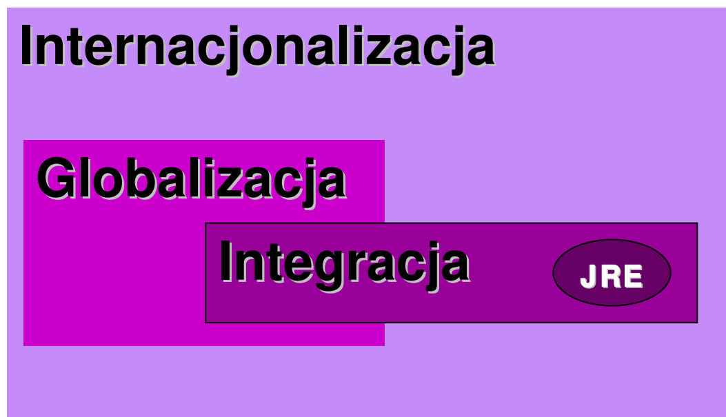
Rys. 1. Relacje pomiędzy procesami internacjonalizacji, globalizacji i integracji