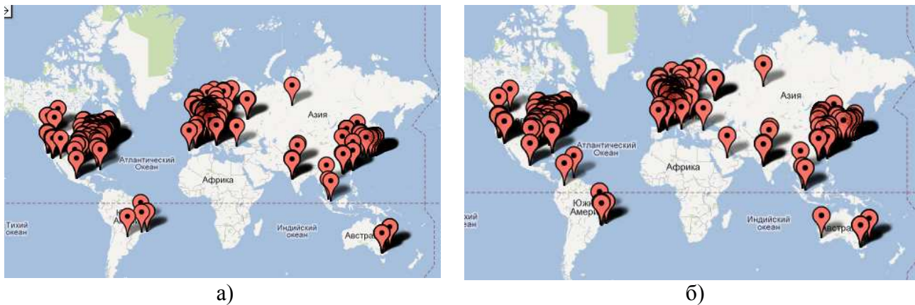
Рис. 1. Розміщення найбільших корпорацій світу за дослідженням журналу «Fortune»: а) 2008 рік; б) 2011 рік

Для прикладу і порівняння, наведемо результати дослідження «Fortune» за останні роки, а саме розміщення найбільших корпорацій світу за дослідженням журналу «Fortune» (рис. 1).