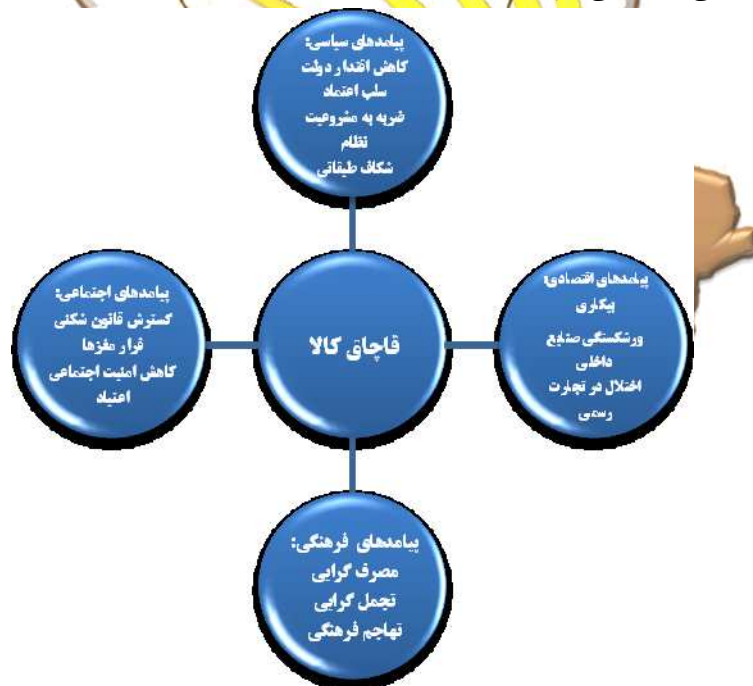
شکل ۲. پیامدهای سیاسی، اقتصادی، اجتماعی و فرهنگی قاچاق کالا

یکی از علل گرایش جوانان در مناطق مرزی به قاچاق عدم فرصت شغلی آنهاست که از راه قاچاق می توانند شاغل شوند و سرمایه ای کسب نمایند. هر ۷ هزار دلار کالای قاچاق که وارد کشور می شود یک فرصت شغلی را از بین می برد (سلطانی نژاد: ۱۳۹۰). بنابراین واردات سالانه ۲۰ میلیارد دلار کالای قاچاق به کشور منجر به از بین رفتن ۲۸۵۷۰۰۰ فرصت شغلی می شود. بنابراین افزایش نرخ بیکاری یکی از پیامدهای اصلی و جدی افزایش قاچاق در کشور است. سایر پیامدهای قاچاق سیاسی، اقتصادی، اجتماعی و فرهنگی قاچاق در شکل ۲ نشان داده شده است (همان).