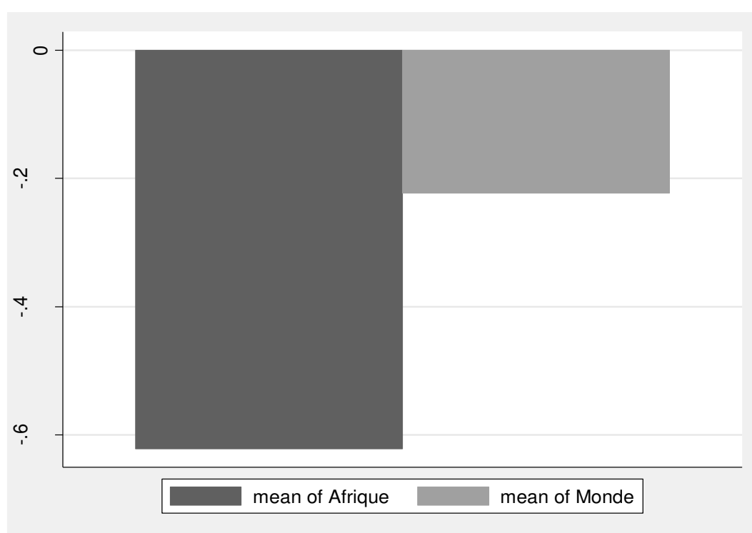
Figure 1. Niveau de la corruption entre l'Afrique et le reste du monde