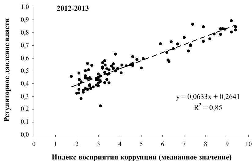
Рис. 3. Связь между регуляторным давлением власти [13] и индексом восприятия коррупции (170 стран)

понимаем отсутствие или недостаточное развитие недискреционных механизмов и институциональных рамок, ограничивающих оппортунизм чиновников любого уровня, независимо от их выборности или назначений на должность.