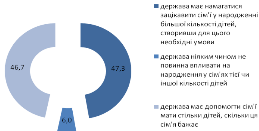
Рис. 1. Розподіл респондентів за оцінкою ролі держави у регулюванні дітородної активності населення

здійснення успішної державної політики у цій сфері, важливою є оцінка населенням її можливостей та результатів. Переважна більшість українців надають перевагу активним заходам демографічної політики, спрямованим на стимулювання дітородної активності. Лише незначна частина опитаних (6%) вважають, що держава ніяким чином не повинна впливати на народження у сім'ях тієї чи іншої кількості дітей (рис. 1). [1, с. 186].