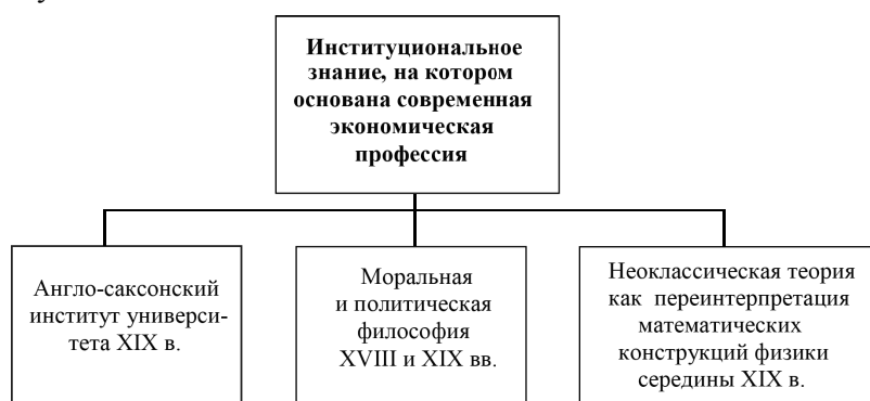
Рис. 3. Источники институционального знания, на котором основана современная экономическая профессия

Далее в этом разделе статьи я попытаюсь обосновать точку зрения, согласно которой современная экономическая профессия функционирует на основании институционального знания, берущего свое начало в институте средневекового европейского университета и центральной дисциплины, преподаваемой в нем, — теологии. Во время институционализации политической экономии в Великобритании и США в конце XIX в. к этим двум источникам было присоединено метафорическое перенесение математических конструкций термодинамики в экономическую дисциплину (см. рис. 3). Очевидно, что такой институциональный багаж не мог привести профессию экономистов к познавательным успехам, которые хоть в какой-то степени были бы близки по их социальной значимости успехам естественных наук.