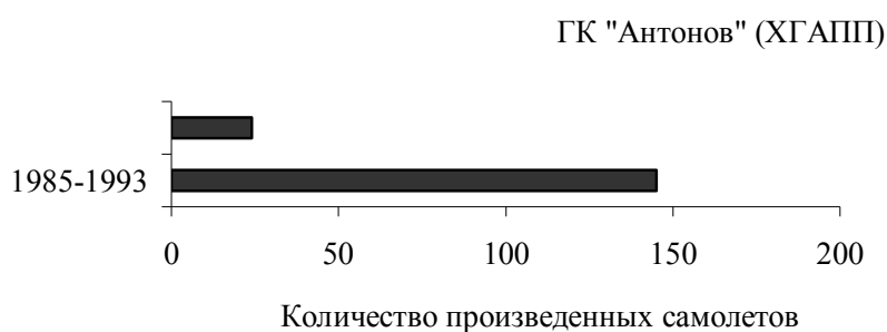
Рис. 5. Результат государственного управления кластером авиастроения в Украине

плане распоряжения национальным достоянием (рис. 5). В результате в товарной структуре экспорта Украины за 2012 г. доля летательных аппаратов составляет 1,345 %, а за 2002–2010 гг. было произведено всего 33 самолета, из них 24 – ГК «Антонов» (ХГАПП), и 9 – ГП "КиАЗ «Авиант»".