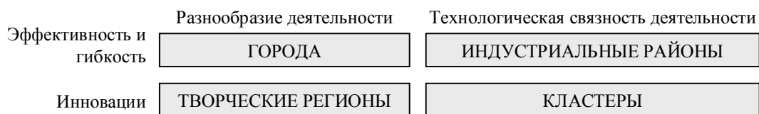
Рис. 1. Четыре типа агломерации [11]

Так, ИТ–кластеры в Силиконовой Долине и Бангалоре являются примерами технологически инновационных кластерных образований, в то время как кластеры модельеров и дизайнеров в Париже и Мумбаи относятся к категории творческих. Кластеры могут вызывать эффект «домино», когда один кластер порождает или усиливает другие, примером чего является кластер оптики в Аризоне, породивший кластеры в пластмассовой, аэрокосмической, экологической сферах деятельности, кластеры информационных технологий и биологических наук.