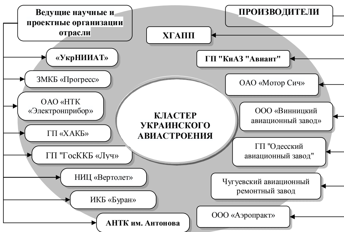
Рис. 3. Структура кластера украинского авиастроения

Примером такой ситуации является украинский кластер авиастроения.