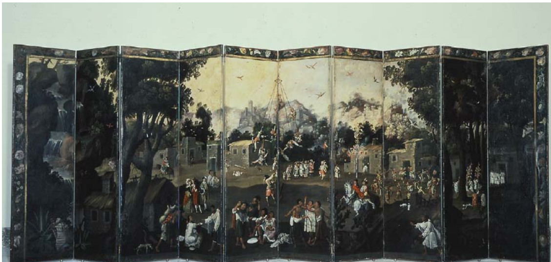
El palo volador, México, 1650-1700. Museo de América de Madrid