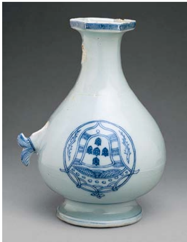
Jarra china para el mercado portugués, c. 1520.

Heilbrunn Timeline of Art History . New York: The Metropolitan Museum of Art, 2000–. http://www.metmuseum.org/toah/works-of-art/61.196 (October 2006)