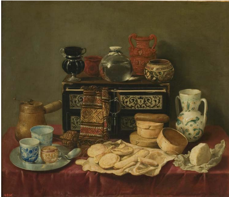
Bodegón con arqueta de marfil , 1652, Antonio de Pereda.