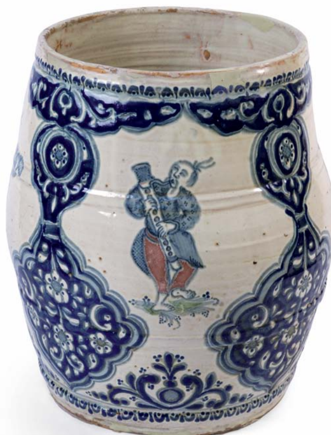
Barril con personaje asiático tocando un instrumento musical, anónimo, Puebla de los Ángeles, siglo XVIII. Colección del Museo Franz Mayer, México.