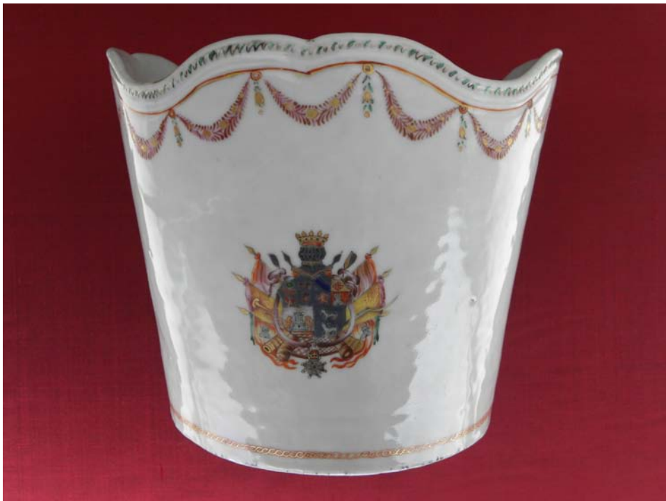
Enfriadora del servicio encargado por don José de Gálvez, Marqués de Sonora, visitador general de la Nueva España (1765-1771). Colección particular.