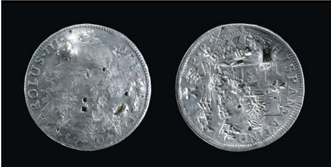
Real de a ocho de plata (diámetro de 39 mms. y 26,520 gras. de peso) con marcas dejadas por un ensayador chino, Potosí, c.1780, Museo Británico, Londres. http://www.britishmuseum.org/explore/highlights/highlight_objects/cm/s/8_reales_coin_with_chopmarks.aspx