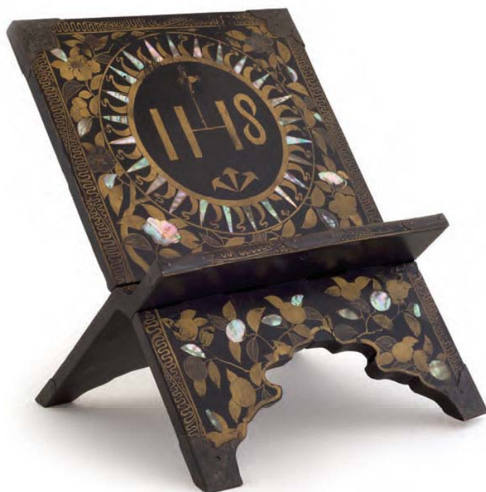
Atril estilo namban , 1580-1614, Japón. Museo Nacional de Artes Decorativas, Madrid.