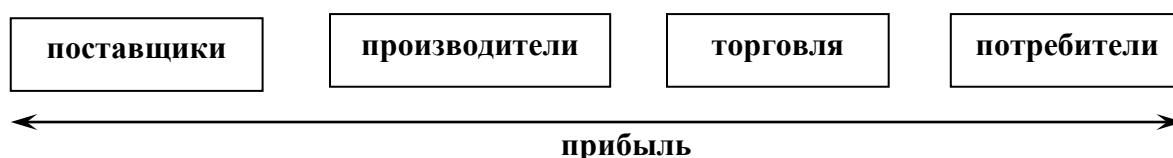
Рис. 2. Распределение прибыли в производственно-торговой цепи поставок

Как видно из вышеизложенного, благоприятные условия для одних рыночных структур неизбежно оборачиваются неблагоприятной ситуацией для других. Именно поэтому реальная предпринимательская деятельность столь напоминает перетягивание каната. Выигрывает тот, кому удастся вынудить партнера пойти на ценовые уступки. Схематично это можно выразить следующим образом: