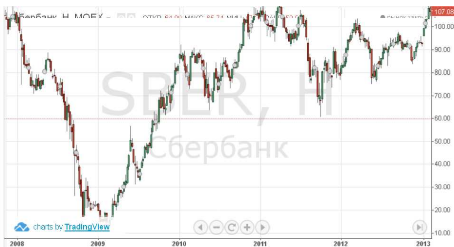
Рис.2 Динамика акций Сбербанка.

На 2015 год эксперты прогнозируют котировку акций Сбербанка на уровне 50 - 70 рублей за акцию. Минимальная область котировок находится на уровне 55 рублей, а максимальная - 75 рублей. По таким ценам и рекомендуется покупать и продавать акции для получения максимальной прибыли. [5]