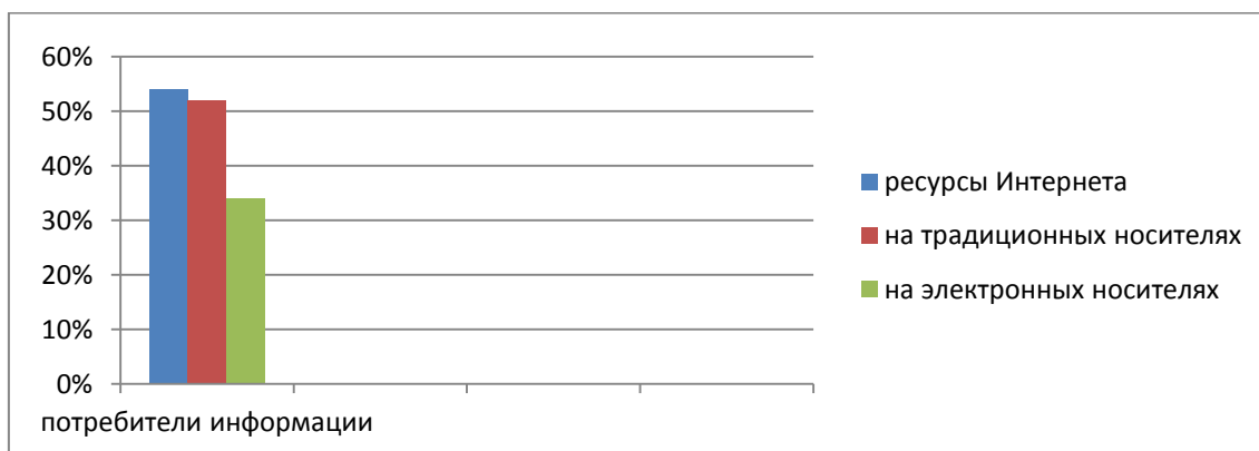
Рис. 1. Предпочтения информационных источников

Библиотеки вузов сегодня – основные держатели разных информационных источников. Предпочтение тех или иных источников будет определяться тем, насколько они удобны в изучении, насколько несут в себе ценную информацию [4]. Владельцами таких источников должны стать вузовские библиотеки с информационными возможно-