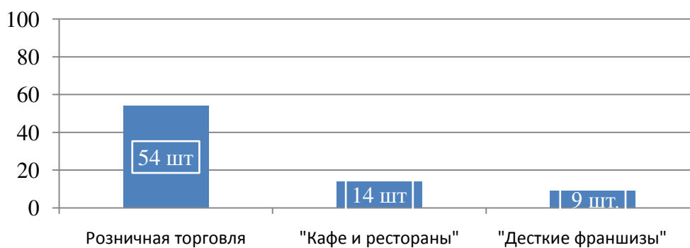
Рис. 2. Первая тройка в рейтинге Российских франшиз