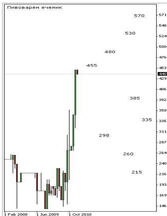
Фиг. 3. Аналог на субективни оценки на ценността в динамика

Оценката на ценността не е общовалидна винаги и навсякъде (не е всеобща). Тя има значение само за определен момент, за хората, които са дали съответните резултати. Същото запитване на друго място или в друго време ще даде други резултати. Теоретично съществува вероятност за съвпадение, но тя би била само случайна и в никакъв случай не може да се ползва като стабилна основа за прогнози и анализи. 7