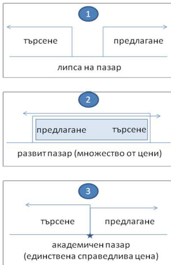
Фиг. 4. Проекции на цена при различна степен на развитост на пазара

определености. От своя страна, цената, въпреки че е обективно съществуваща, тя също е субективно определима и относителна. Това е защото, цената е онази величина на стойността и ценността, взети заедно, която реално позволява стоката да смени притежателя (ползвателя) си. 8 И в този случай се сблъскваме не с една единствена цена, а отново с множество от цени. Горното се потвърждава от ежедневните котировки на организираните финансови пазари, където цените могат да се ползват като сравнително обективен информационен източник и се позиционират в съвкупността от цени между минималната и максималната. Обратно, при неразвити пазари, където търсенето и предлагането не се срещат, не може да се формира и цена. „Точкова” проекция цената може да придобие единствено при академичните допускания за идеални пазари. (вж. фиг. 4.)