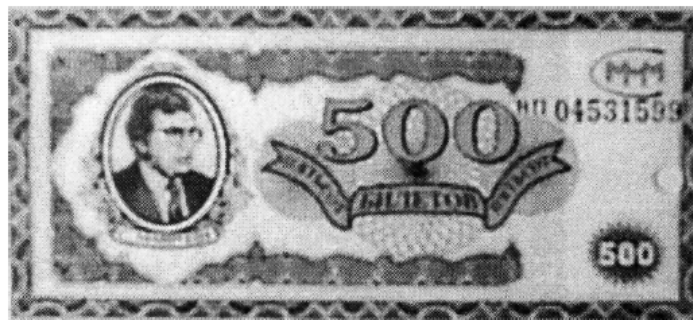
Слика 3. – Билет МММ

Почело је саопштењем пореске полиције да је једна од структура МММ-а, АОЗТ Инвест-консалтинг, избегла да плати порез због чега му је изречена казна од 49,9 милијарди рубаља (око 26 милиона долара, укључујући и неплаћени износ пореза). Ова сума била је за МММ сасвим подношљива, али је С. Мавроди одлучио да не плати казну и да се конфронтира с порезницима. Овај спор изазвао је панику и људи су почели да траже могућности да се што пре ослободе акција и билета. МММ је испрва испуњавао све обавезе покушавајући да умири улагаче, али је ипак ускоро био принуђен да све пунктове затвори до бољих времена. Скандал је имао такву снагу да је ситуацију око МММ-а разматрала и руска влада.