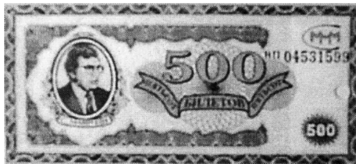
Слика 3. – Билет МММ

Почело је саопштењем пореске полиције да је једна од структура МММ-а, АОЗТ Инвест-консалтинг, избегла да плати порез због чега му је изречена казна од 49,9 милијарди рубаља (око 26 милиона долара, укључујући и неплаћени износ пореза). Ова сума била је за МММ сасвим подношљива, али је С. Мавроди одлучио да не плати казну и да се конфронтира с порезницима. Овај спор изазвао је панику и људи су почели да траже могућности да се што пре ослободе акција и билета. МММ је испрва испуњавао све обавезе покушавајући да умири улагаче, али је ипак ускоро био принуђен да све пунктове затвори до бољих времена. Скандал је имао такву снагу да је ситуацију око МММ-а разматрала и руска влада.