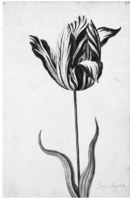
Слика 1. – Семпер Аугуст

заузели су и судови којима су се затим почели обраћати продавци, покушавајући да истерају наплату претходно скупо продатих луковица, а што су нови дужници почели да одбијају и избегавају. Судови су свој став образлагали тиме да такви уговори имају „шпекулативни карактер” те да сходно томе и дугови, односно потраживања настали на основу њих нису законити тако да нема основа за мешање судства. 5 Што се друге стране (преварених и осиромашених) тиче, они су поставили готово универзални образац који затим, с мање или више успеха, следе преварени у готово свакој афери.