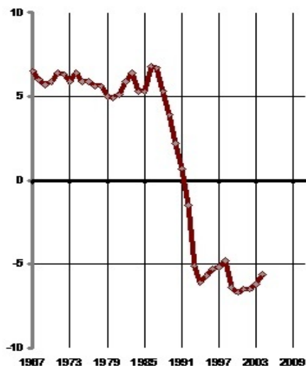
Слика 3. Природни прираштај становништва РСФСР и РФ (1967–2004), на 1.000 становника