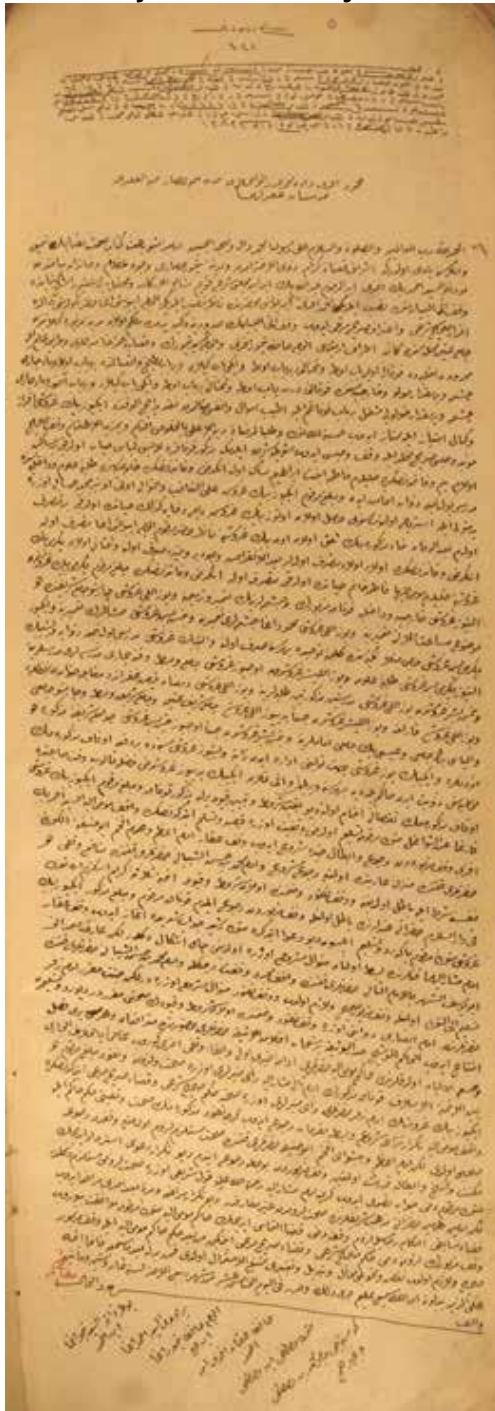
Resim 1. Örnek Vakfiye – Ahmed Bey bin Abdullah Bey Vakfı