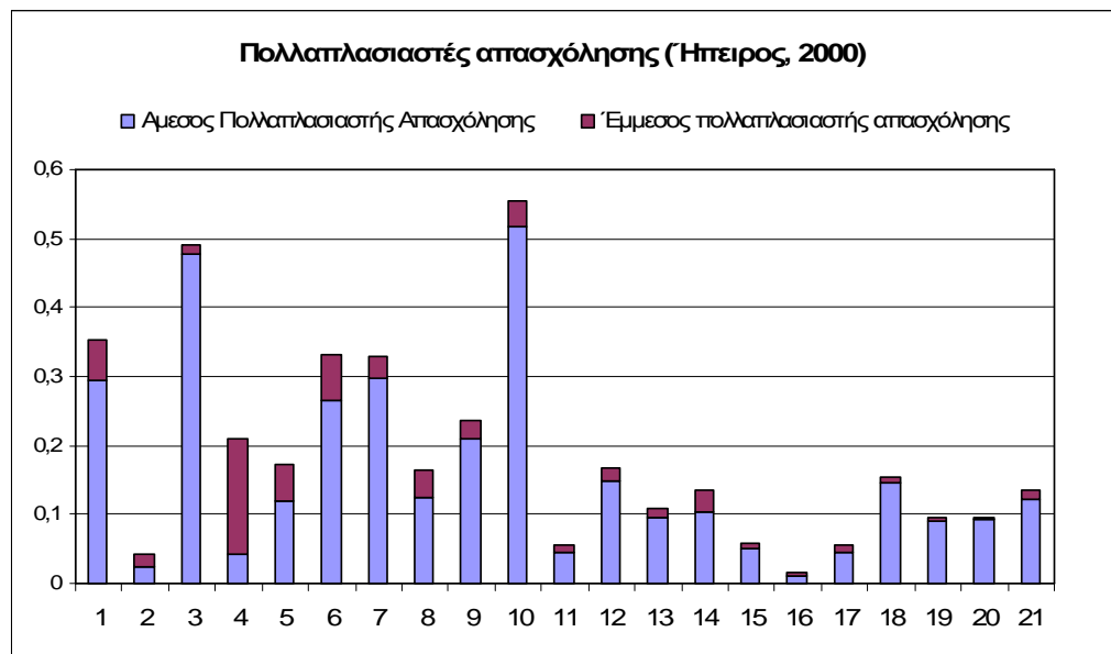
Διάγραμμα 1: Άμεσοι και Έμμεσοι Πολλαπλασιαστές

Όπως προκύπτει από διάγραμμα 1, οι κλάδοι με τους μεγαλύτερους άμεσους συντελεστές είναι: η κατασκευή μηχανημάτων και λοιπών ειδών εξοπλισμού (10), τα μεταλλεία-ορυχεία (3), η παραγωγή χημικών και ελαστικών (7), η γεωργία (1) και η βιομηχανία ξύλου (6). Στην περίπτωση των συνολικών πολλαπλασιαστών οι κλάδοι που δημιουργούν τα μεγαλύτερα πολλαπλασιαστικά αποτελέσματα στην απασχόληση της περιφέρειας παραμένουν οι ίδιοι, με διαφορετική κατάταξη. Εκεί όμως που διαφοροποιείται, σχεδόν πλήρως, η σημαντικότητα των κλάδων είναι στην περίπτωση των έμμεσων μεταβολών. Παρατηρούμε ότι οι κλάδοι: τρόφιμα-ποτά και καπνός (4), βιομηχανία ξύλου (6), γεωργία (1), παραγωγή κλωστο/υφαντουργικών ινών (5), παραγωγή μη μεταλλικών ορυκτών (8), και κατασκευή μηχανημάτων και λοιπών ειδών εξοπλισμού (10) είναι οι σημαντικότεροι κλάδοι στην αύξηση της απασχόλησης, που οφείλεται στις έμμεσες διασυνδέσεις τους. Επιπλέον, ένα στοιχείο που πρέπει να λάβουμε υπόψη μας είναι η συμμετοχή (%) του έμμεσου συντελεστή στον συνολικό πολλαπλασιαστή. Έτσι, οι κλάδοι τρόφιμα-ποτά και καπνός (4), αλιεία (2), χρηματοπιστωτική διαμεσολάβηση (16), μαζί με τους παραγωγή κλωστο/υφαντουργικών ινών (5), παραγωγή μη μεταλλικών ορυκτών (8) εμφανίζονται στην πρώτη πεντάδα. Παρατηρούμε ότι σε κλάδους που η περιφέρεια διαθέτει συγκριτικά πλεονεκτήματα συνδεδεμένα με την πρωτογενή παραγωγή έχει αναπτυχθεί ένα 'πλέγμα' κάθετων διασυνδέσεων με σημαντικά πολλαπλασιαστικά αποτελέσματα στην οικονομία της.