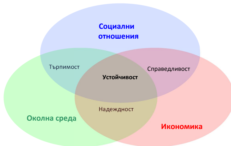
Фигура 3: Съвременно разбиране на концепцията за устойчиво развитие 1

Не може да се пренебрегне нито един от аспектите на устойчивостта. Ако обществото консумира повече, отколкото създава, ще натовари с непосилни плащания следващите поколения, т.е. обществото ще стане икономически неустойчиво. Има достатъчно примери за такова неустойчивост – като се започне от Зимбабве в другия край на планетата и се свърши с Гърция, която е до нас. Лош пример в това отношение дават и някои от икономически най-развитите страни, които консумират значително повече отколкото произвеждат. Япония, например, е натрупала държавен дълг почти два пъти и половина по-голям от брутният ѝ вътрешен продукт, а световният икономически лидер САЩ имат държавен дълг надхвърлящ общия доход на страната за цяла година. Натрупаните задължения, при една по-висока лихва, каквато се очаква скоро да има, ще породят огромни затруднения пред бюджетите не само на развиващите се, но и на най-развитите икономики.