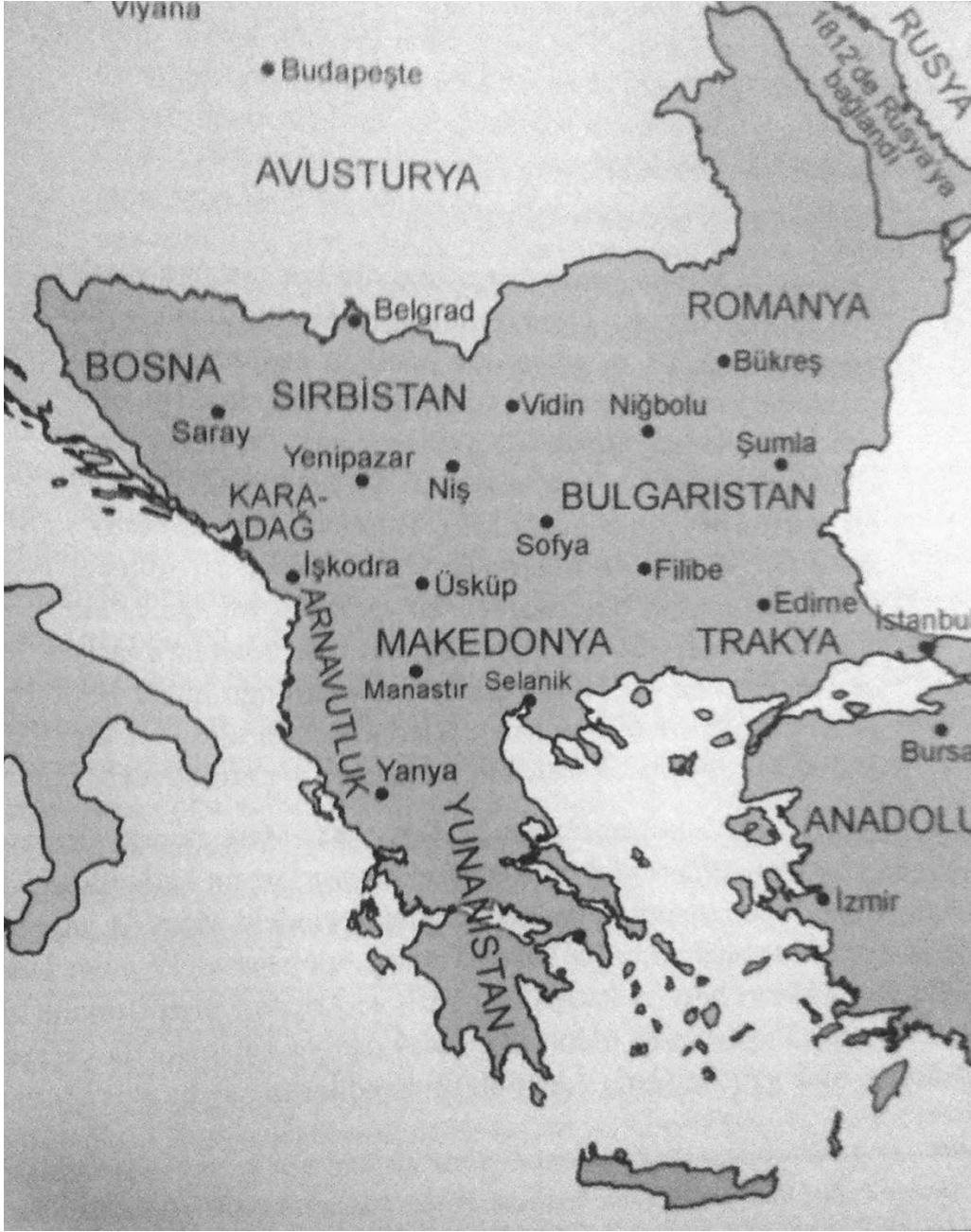
Harita 1. 19. Yüzyıl Başında Osmanlılar Yönetimi Altındaki Balkan Toprakları