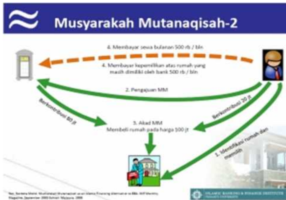
Skema Pembiayaan akad Musyarakah Mutanaqisah

Kontrak yang berikutnya adalah kontrak Ijarah diantara Bank A dengan pembeli B, dimana pembeli B melakukan pem-bayaran sewa kepada Bank A setiap bulannya, misalkan pada harga Rp. 500,000. Dari Rp. 500,000 ini, akan dibagi berdasarkan proporsi kepemilikan. Jika proporsi Bank A 80%, maka dari uang sewa yang pertama, bank akan mendapat upah sewa sebesar Rp. 400,000. Dan konsumen akan mendapat Rp. 100,000, dengan proporsi kepemilikan hanya 20%. Untuk memperjelas, berikut Gambar VI.2 adalah skema awal dari akad MM ini.