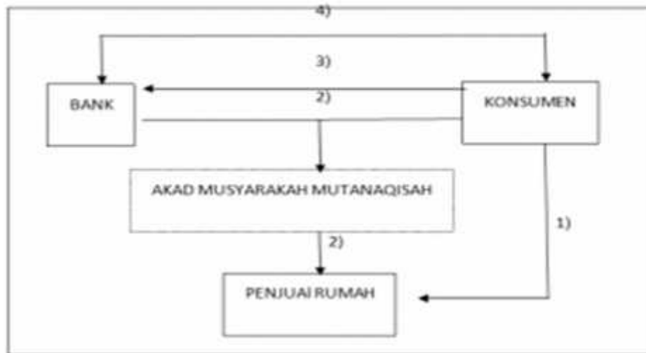
Skema Pembiayaan Rumah dengan akad MM

Tahapan dari skema yang digambarkan diatas adalah se-bagai berikut: