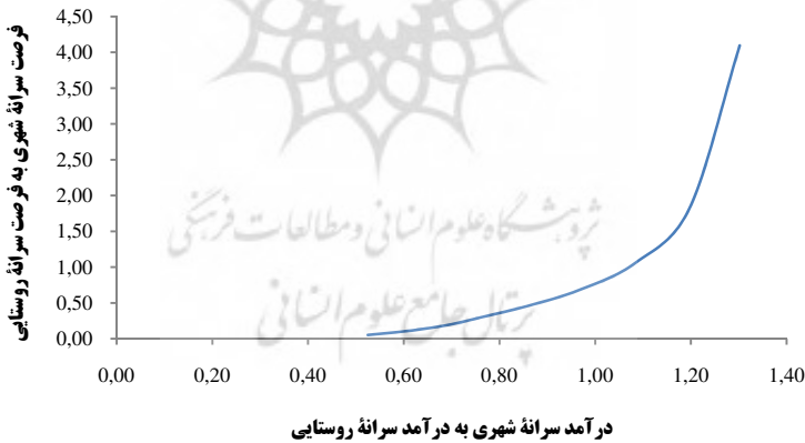
نمودار ۳. تغییر درآمد سرانه با تغییر فرصت‌های سرانه

نتایج به دست آمده حاکی از آن است که با افزایش نابرابری در فرصت‌ها شاخص نابرابری در درآمد سرانه رشد سریع تری دارد. به عبارت دیگر، با افزایش نابرابری فرصت‌ها، شکاف درآمدی بیش از شکاف فرصت‌ها بزرگ می‌شود. از این مسئله نتیجه‌ای بسیار مهم استخراج می‌شود یا به عبارتی این پدیده نشان می‌دهد که با «کاهش نابرابری فرصت‌ها می‌توان کاهش بیشتری در نابرابری درآمدی مشاهده کرد».